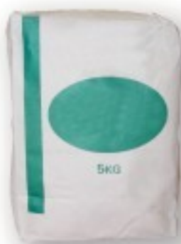
Massa de juntas em sacos de 5kg