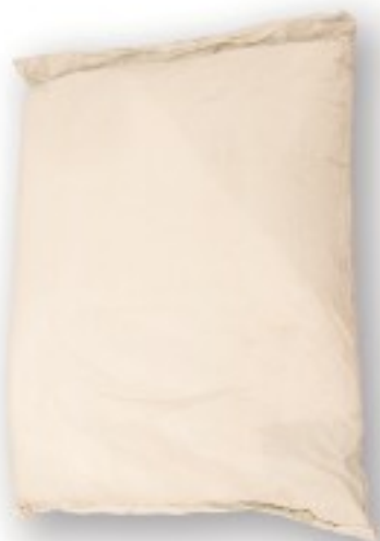
Pó de gesso em sacos de 20 kg