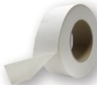
Papel tapa juntas em rolos de 50mx5cm